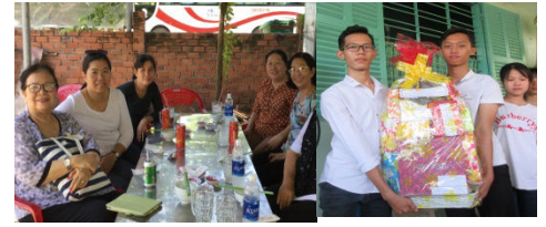
Pêlè-mêlè La Présidente accompagnée de sa délégation dans les différentes provinces